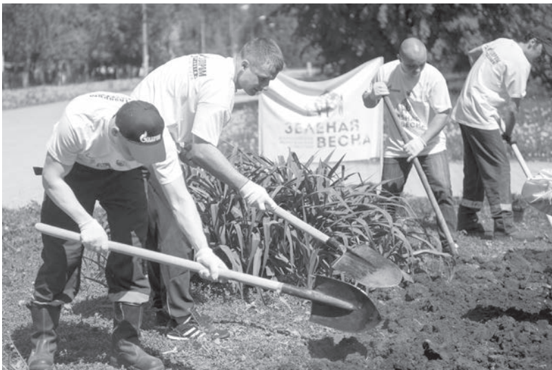
Здесь будет очередная красивая клумба.

Более двух тысяч работников ООО «Газпром трансгаз Чайковский» приняли участие в мероприятиях экологической направленности в рамках Всероссийского экологического субботника «Зелёная Весна – 2016». В результате совместных действий газовой собрали более 200 тонн мусора, очистив при этом 155 гектаров земли, и высадили более 10 тысяч деревьев и кустарников.