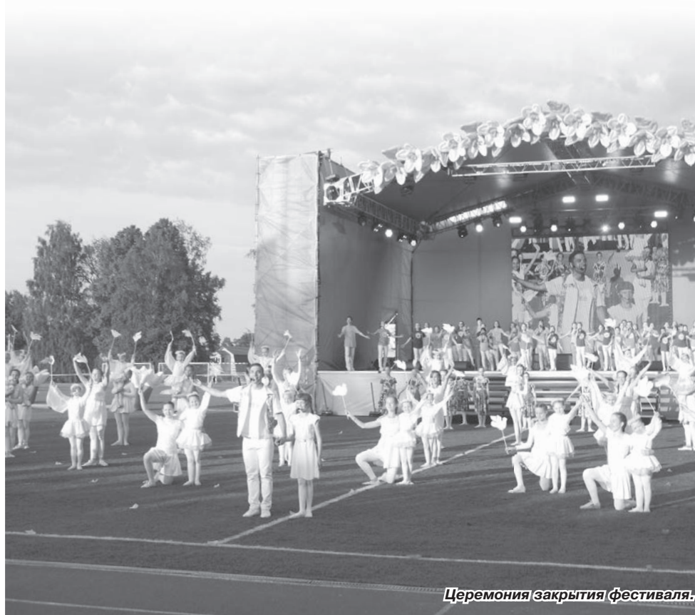
Церемония закрытия фестиваля.